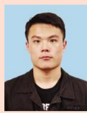
杜亦明 英才实验学院党总支