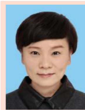
何佳 机关与直属单位党委