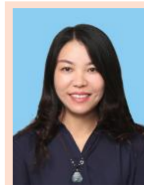
邹洁 图书馆党总支