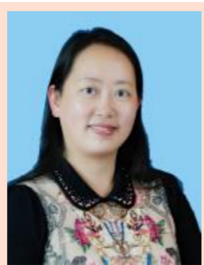
何曲 外国语学院党委