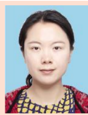
张进 英才实验学院党总支